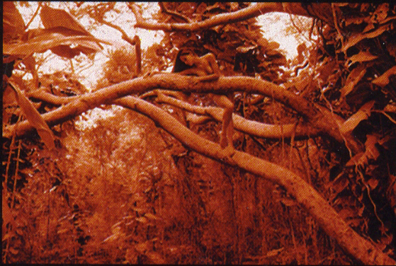
Dríada 66 X 41 1/2