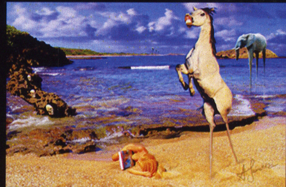
La Tentación de Antonio 20 x 30