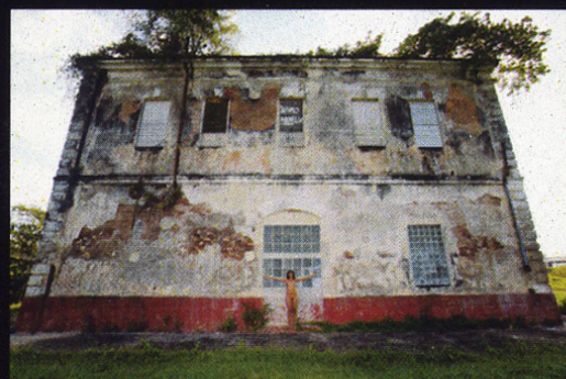
Naturaleza Viva Dentro de Naturaleza Muerta 20 x 30