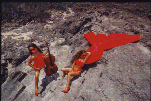
Cuadros de una Exposici3n II 18 x 30