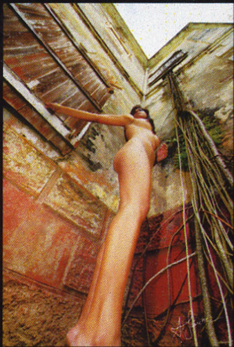
Siempre nos Uniremos en el Infinito 20 x 30

Esperaré despierto, Trazando Caminos, Soñando con volar, a los paraísos perdidos, en el combate eterno de nuestras madrugadas, para ser el guardián de tus sueños.