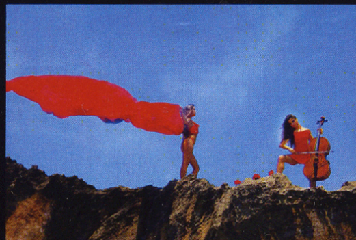
Cuadros de una Exposici3n III 18 x 24