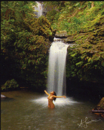
Libertas 20 x 30

Y mañana... al despertar el alba, cuando estés despierta ya entre mis versos, y yo me duerma en el cálido silencio de tus palabras prohibidas Solo entonces..... podemos volar.