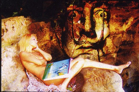
Sueño Surrealista 20 x 30