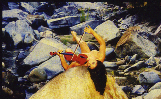
La Tentaci3n Viva Arriba 20 x 30