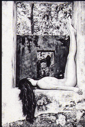
Marco sobre Marco 21 X 34

Esperaré despierto, Trazando Caminos, Soñando con volar, a los paraísos perdidos, en el combate eterno de nuestras madrugadas, para ser el guardián de tus sueños.