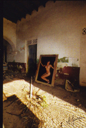
Cuadro Apocalíptico 20 x 30