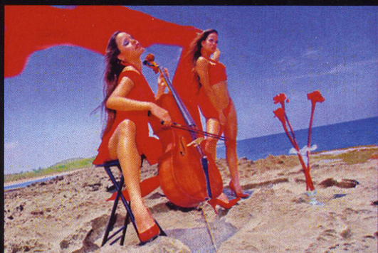
Cuadros de una Exposici3n I 18 x 24