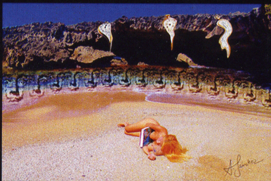
El tiempo hacedor de Imágenes 20 x 30