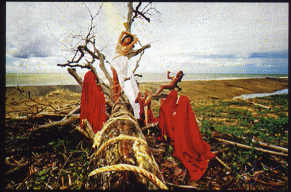
El Sacrificio, las Píadas y la Tentación 20 x 30